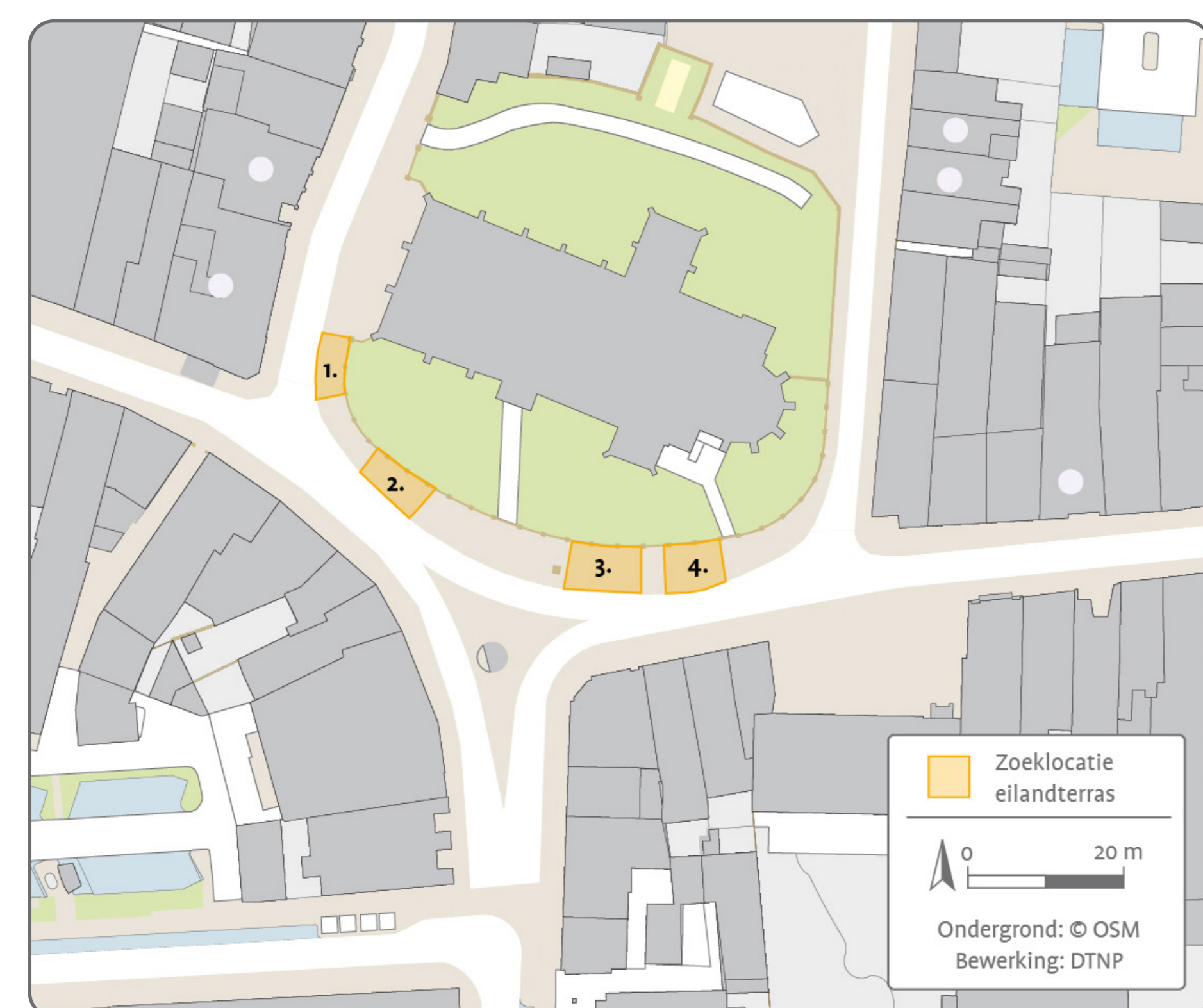
Locaties voor eilandterrassen in Oud Rijswijk