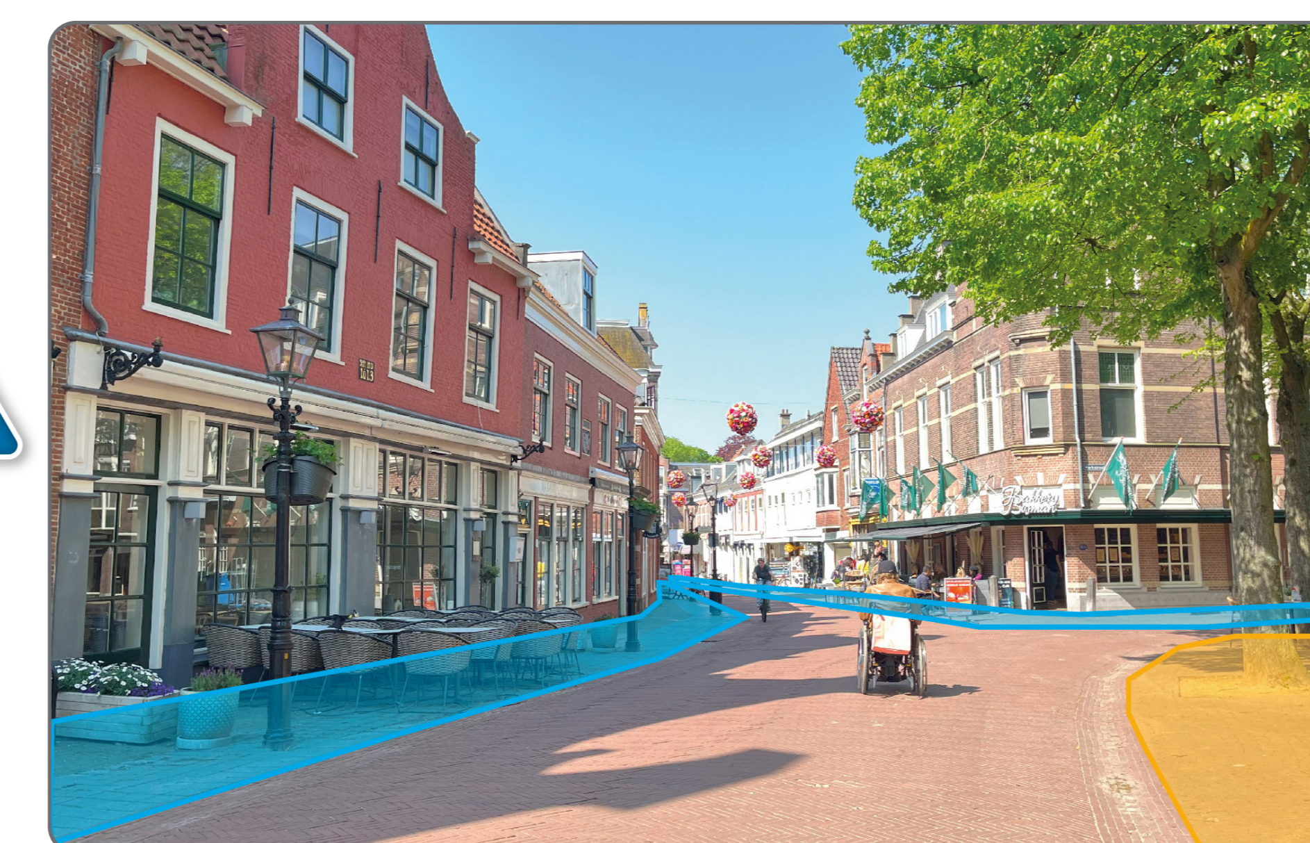
Beperkte bouwmogelijkheden voor terrassen nabij Oude Kerk