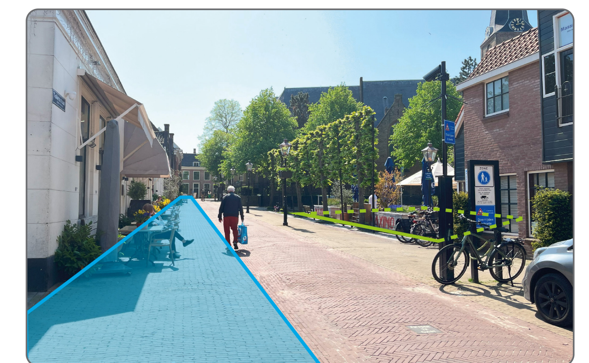
Verschiede terrasmogelijkheden bij het Tollensplein