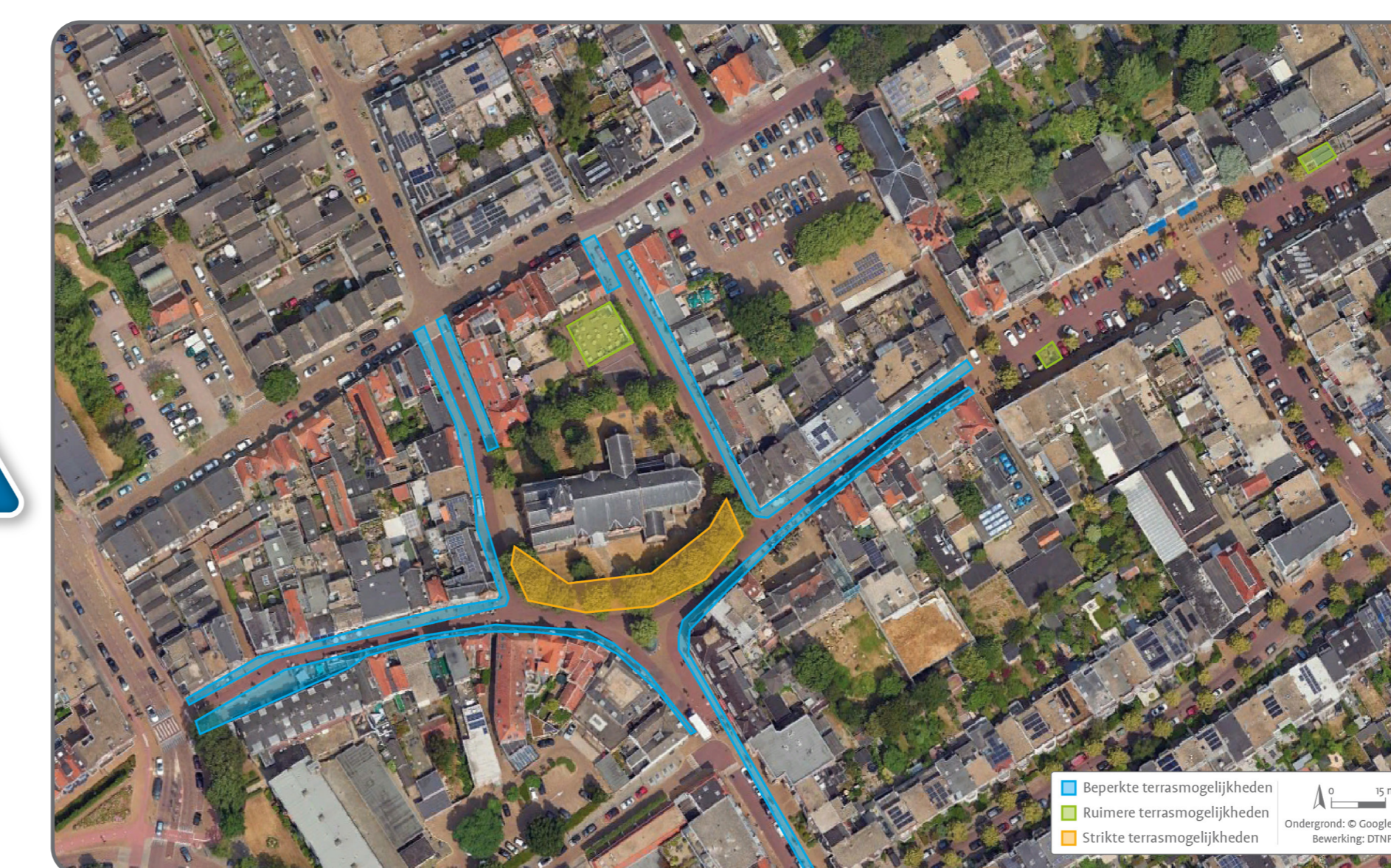
Mogelijkheden voor terrassen per deelgebied