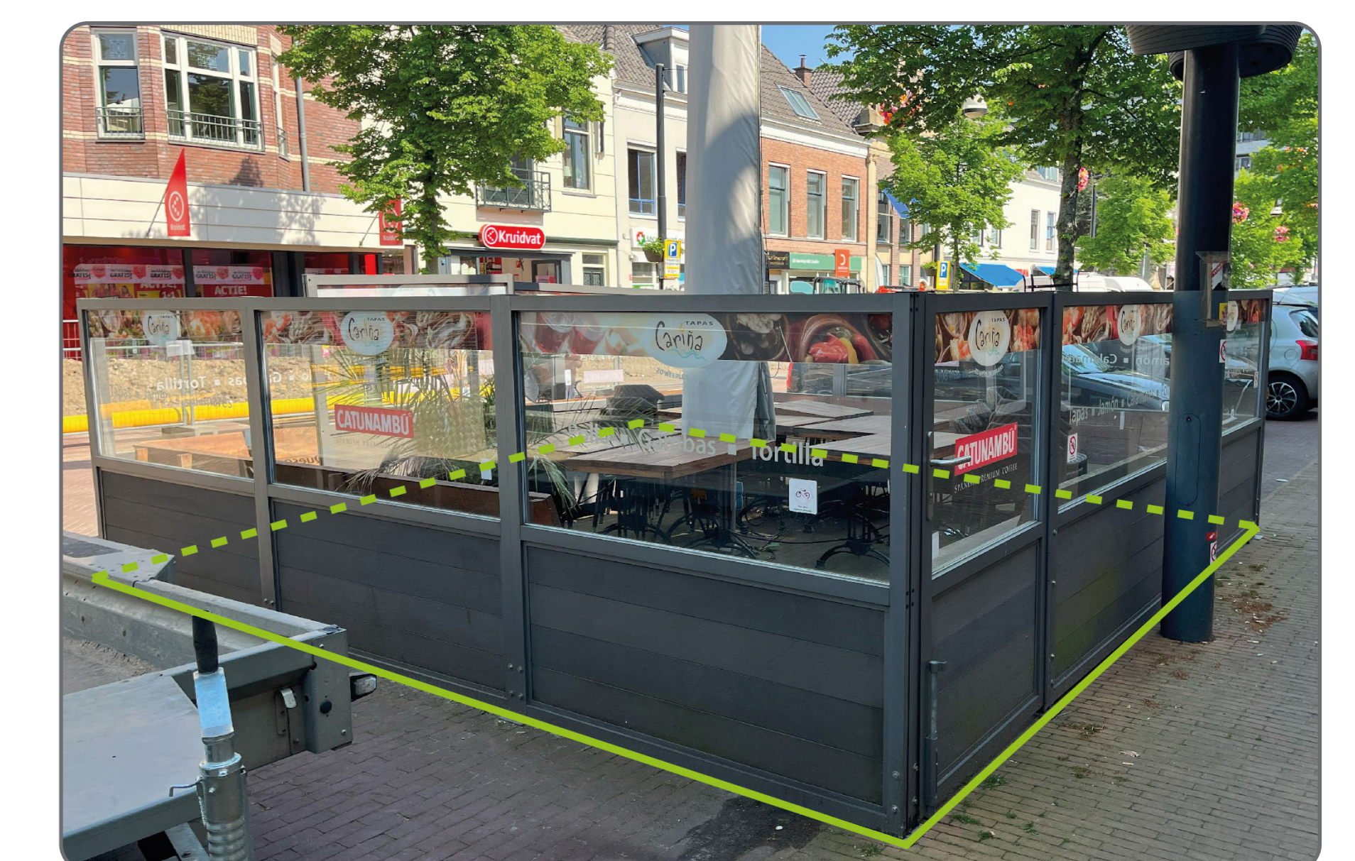
Ruimere bouwmogelijkheden voor terrassen bij Herestraat-Oost